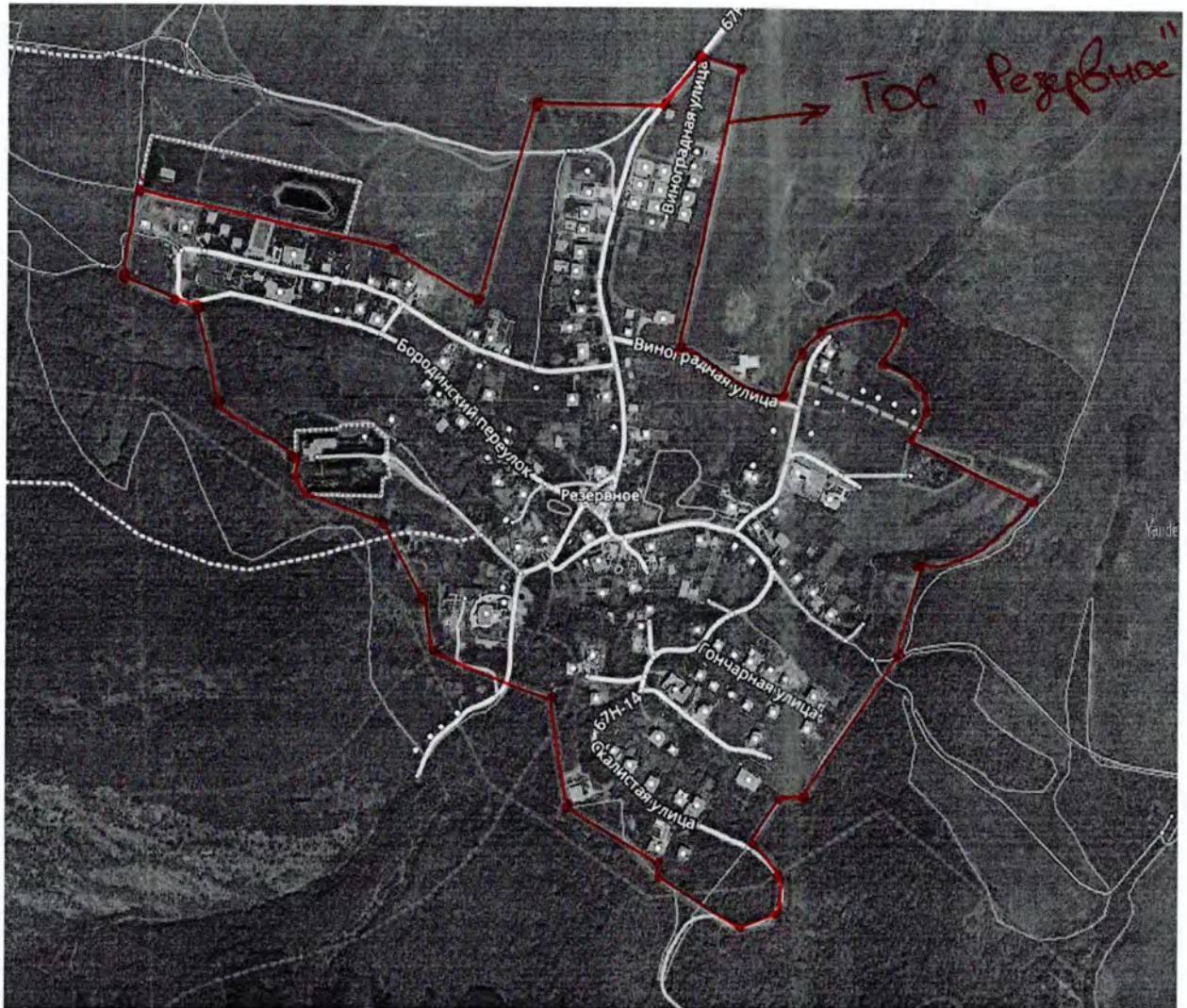
Схема и описание границ территориального общественного самоуправления (ТОС) Резервное

Принятое к решению Совета Оршмовской МО от 06.03.2020 №10/171.